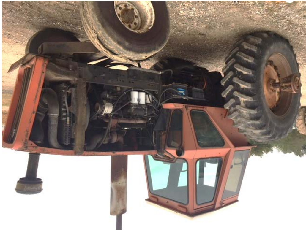
Figura 8. Foto de antes, con rieles del bastidor sin cortar