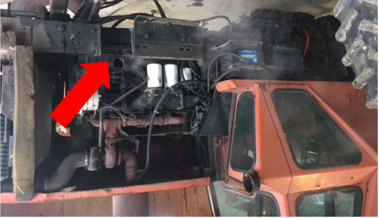
Figura 11. Foto de después, con riel del bastidor cortado