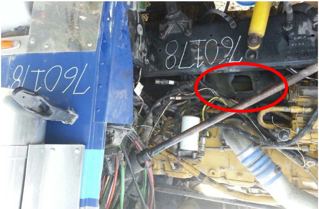
Figura 5. Foto de después, bloque del motor con agujero de 3 pulgadas o más