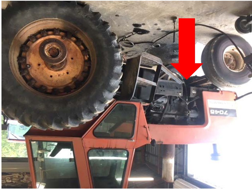
Figura 9. Foto de después, equipo destruido (con rieles del bastidor cortados)