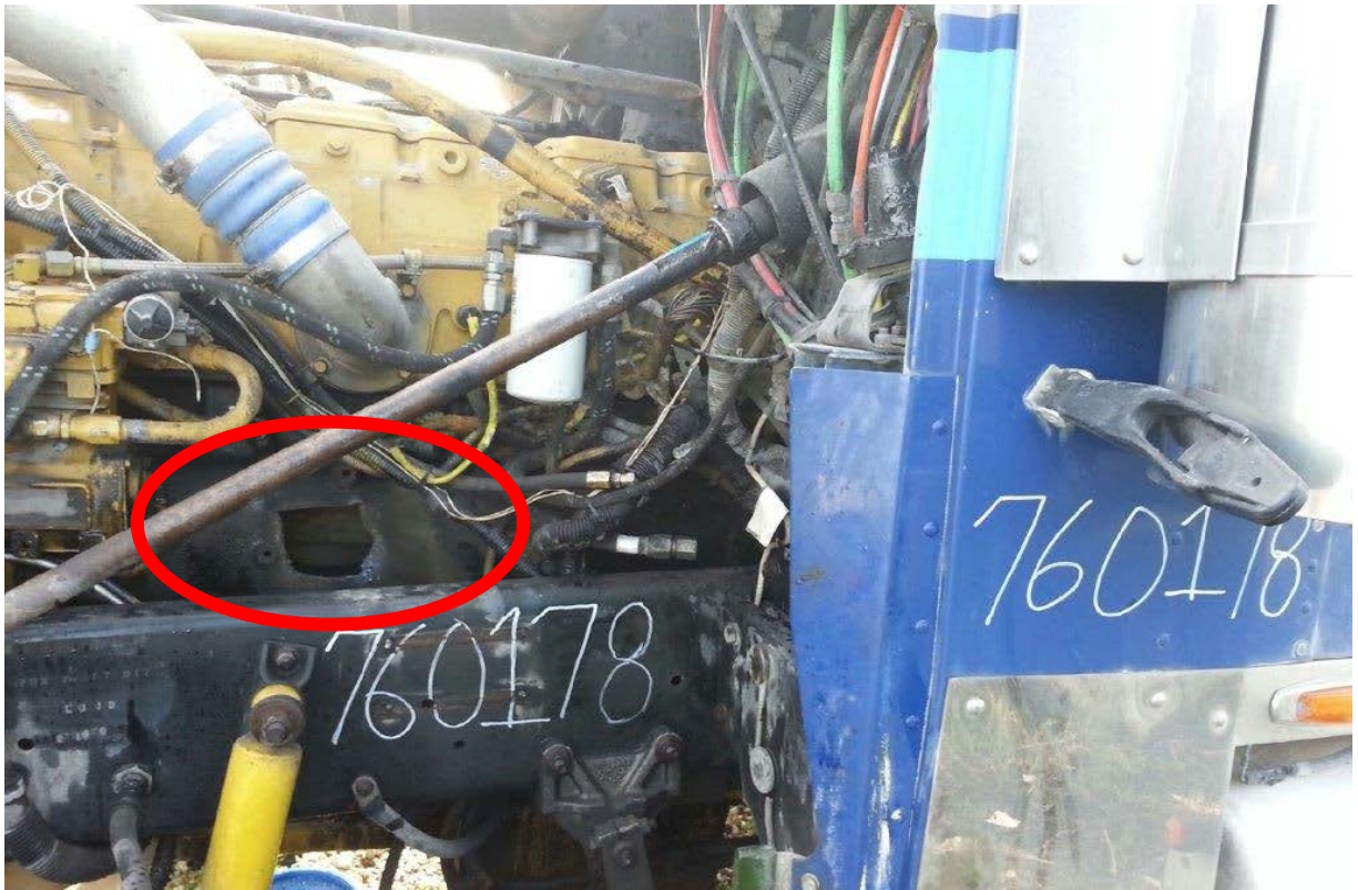
Figure 5. After Photo, Engine Block with Hole 3 Inches or Larger