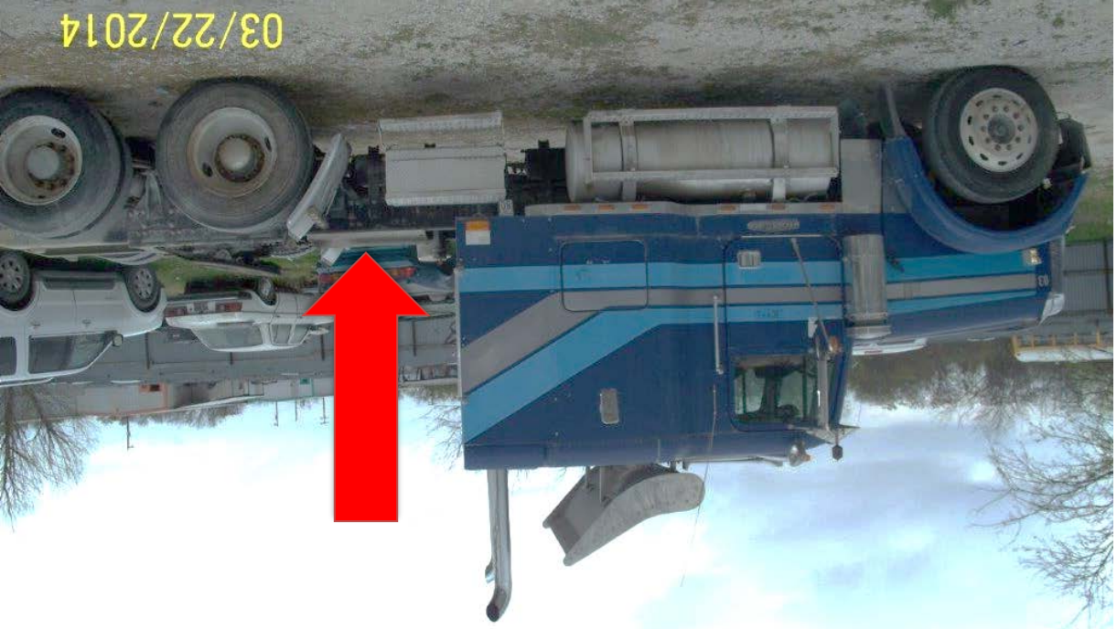
Figura 4. Foto de después, vehículo destruido (con rieles del bastidor cortados)